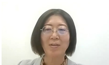
伊藤児童生徒課長